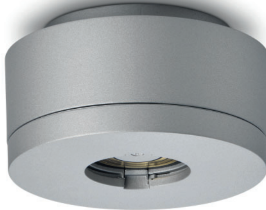
Bild 1: Plug & Light Baldachin mit Plug & Light Lichtsteckdose mit Bajonett