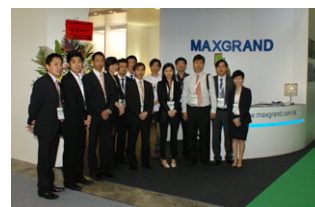
Mit einem 13-köpfigen Team hat der Insta Vertriebspartner Maxgrand an 3 Messetagen das Insta LED-Leuchtenprogramm in Hongkong vorgestellt.

Zufrieden mit dem Erfolg schaut Maxgrand nach vorne auf die kommenden Gespräche. Schließlich hat man viele neue Kontakte während der Messezeit geknüpft.