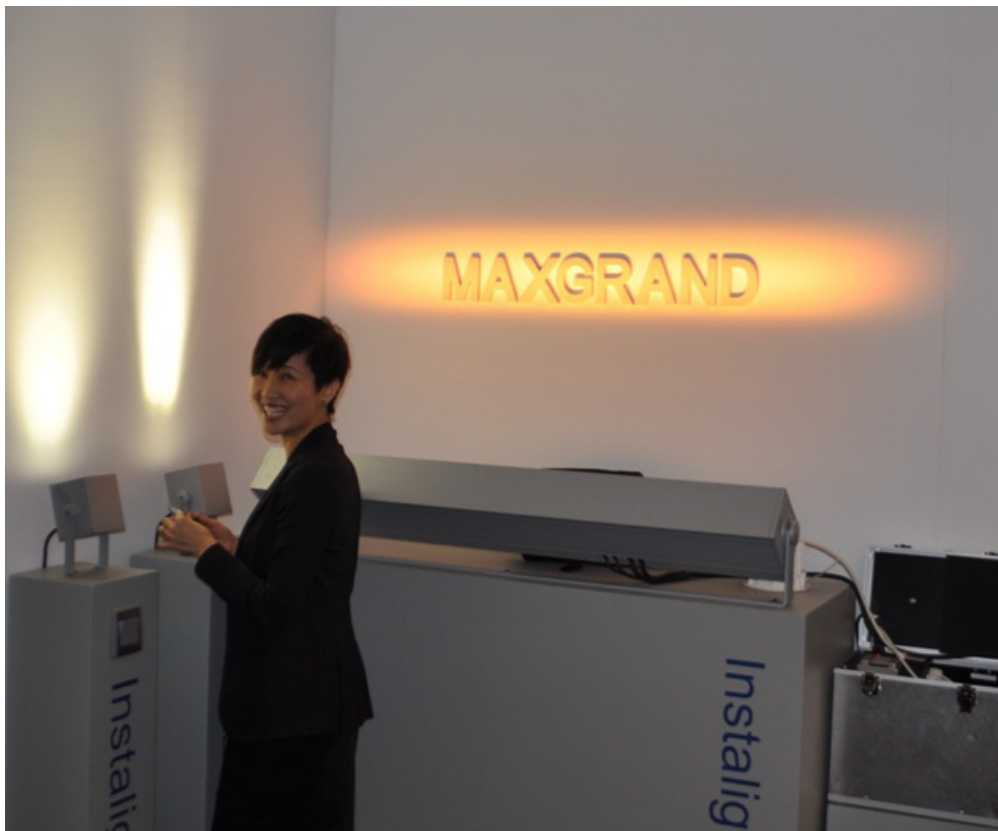
Auftritt in Hongkong mit den »Stars« aus dem Insta Produktprogramm